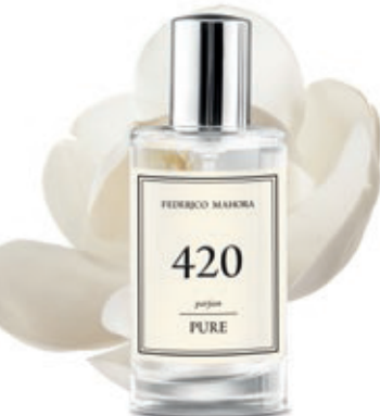
PERFUME Capacidad: Perfume 50ml Fragancia: 20%