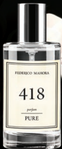
PERFUME Capacidad: Perfume 50ml Fragancia: 20%