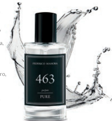
PERFUME Capacidad: Perfume 50ml Fragancia: 20%